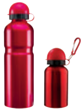
TAMAÑOS TMPS 101 Y TMPS 400