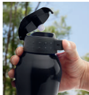
Incluye válvula de seguridad.