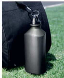
Cilindro triangular. Incluye gancho.